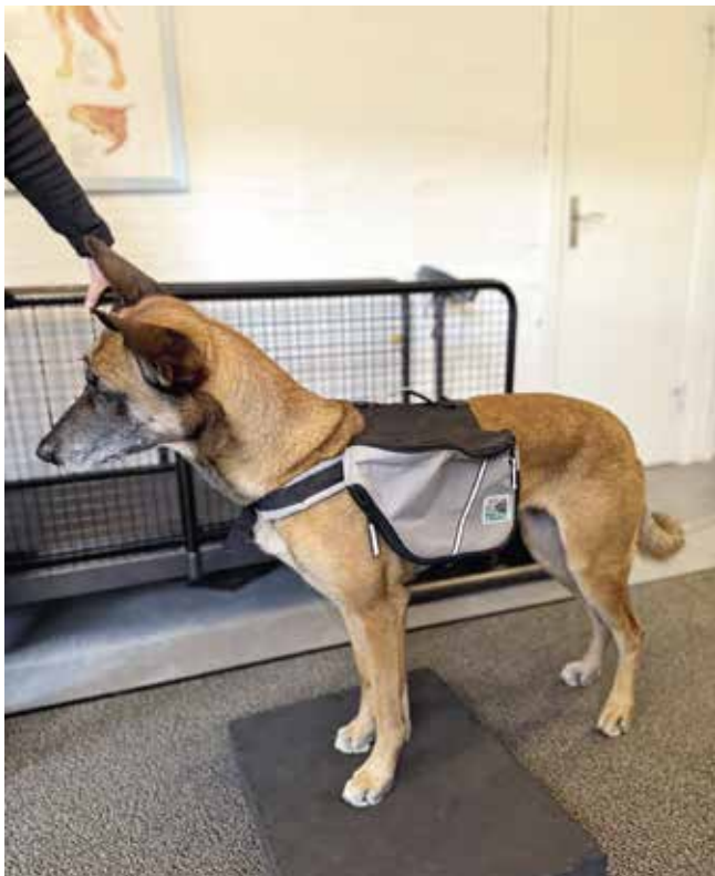
Väska med bogrem framför bogbladet.