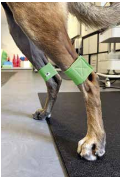
Korrekt placering ovan hasled.

Kårt barn har många namn och som jag nämnde i inledningstexten kan man benämna dessa band på flera olika sätt; viktband, powerbands eller benviktsmanschetter. Man jobbar antingen med eller utan vikt i benviktsmanschetterna.