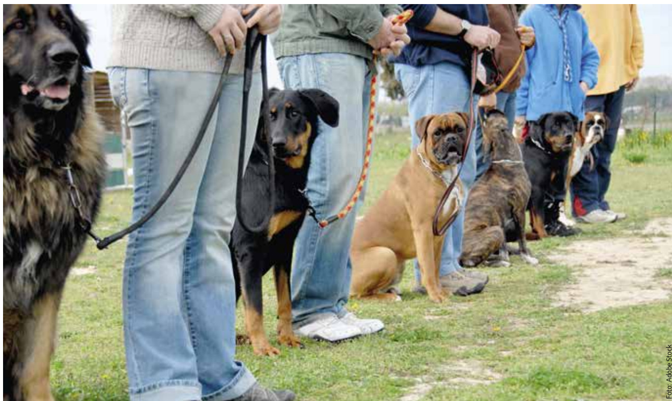
Att gå kurs är ett bra sätt att lära känna sin hund och få hjälp tidigt vid behov.

finns det mycket man skulle kunna göra. Det handlar främst om hur vi ser på hundar mentalt – utbildningar, diskussioner och forum kring dessa frågor vore väldigt värdefulla. Tävlingsverksamheten skulle också kunna utvecklas, så att vi får en gemensam syn på hur tävlingar ska utformas. Jag anser till exempel att det finns ett stort behov av att se över reglerna kring bruksprov eftersom de tyvärr inte längre stämmer överens med samhällets krav.