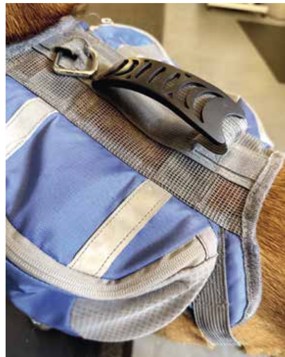
Tunn ryggdel med handtag.