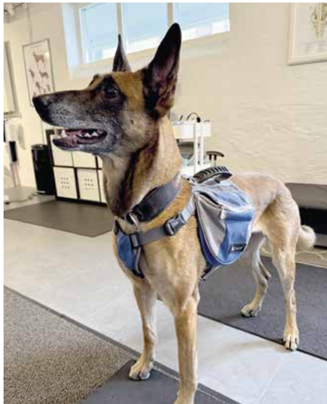
Väska med Y-passform.

den. Dessa brukar kunna hämma rörelseuttaget i frambenet, så vid långvarig, återkommande fysträning ser vi gärna att hunden har fri möjlighet till att röra hela skulderbladet, vilket den får i en Y-formad sele.